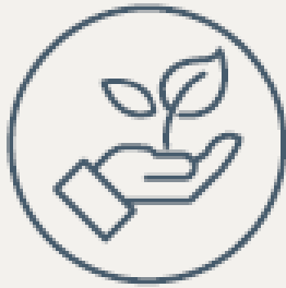
Sociedade e Meio Ambiente