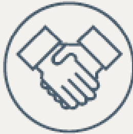
Parceiros de Negócios