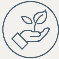
Société et environnement