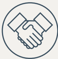
Parceiros de negócio