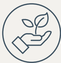
Sociedade e o ambiente